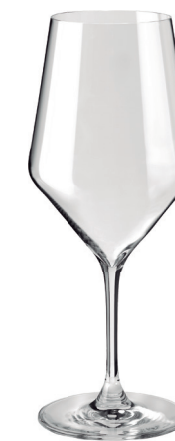
COPA DOÑA PERFECTA 7GB REF: CO6960

Capacidad / Capacity: 480 ml / 16,23 oz. Diámetro boca / M. diameter: 65 mm. Diámetro / Diameter: 90 mm. Altura Cáliz / Calyx height: 130 mm. Altura Total / Total height: 215 mm. 6 unidades por caja / pieces per box.