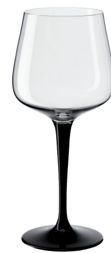
COPA MAGNUM PIE NEGRO REF: CO6587MN

Tecnología de Pie Estirado Pull Stem Technology