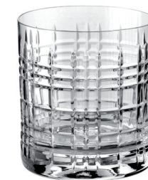
VASO WHISKY TALLADO 280 ML REF: VAG1605WT

Capacidad / Capacity: 280 ml / 9,47 oz. Diámetro / Diameter: 80 mm. Altura / Height: 88 mm. 6 unidades por caja / pieces per box.