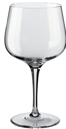
COPA GIN & TONIC REF: CO6587

Tecnología de Pie Estirado Pull Stem Technology