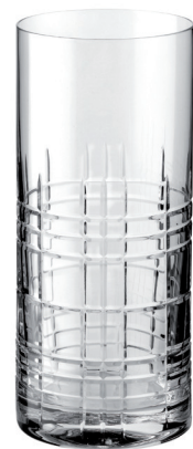
VASO HIGHBALL TALLADO REF: VAG1605LDT

Capacidad / Capacity: 440 ml / 14,88 oz. Diámetro / Diameter: 70 mm. Altura / Height: 161 mm. 6 unidades por caja / pieces per box.