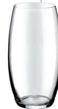
VASO ELIP 550 ML REF: VAG4932LD2

Capacidad / Capacity: 530 ml / 17,92 oz. Diámetro / Diameter: 95 mm. Altura / Height: 100 mm. 6 unidades por caja / pieces per box.