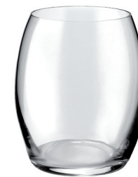
VASO ELIP 350 ML REF: VAG4932AG

Capacidad / Capacity: 350 ml / 11,83 oz. Diámetro / Diameter: 80 mm. Altura / Height: 95 mm. 6 unidades por caja / pieces per box.