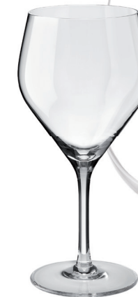
COPA GRAN BARMAN REF: CO6799GB

Capacidad / Capacity: 620 ml / 20,97 oz. Diámetro boca / M. Diameter: 88 mm. Diámetro / Diameter: 105 mm. Altura Cáliz / Calyx height: 115 mm. Altura Total / Total height: 185 mm. 6 unidades por caja / pieces per box.