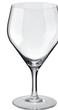
COPA BARMAN REF: CO6799B

Capacidad / Capacity: 660 ml / 22,32 oz. Diámetro boca / M. Diameter: 74 mm. Diámetro / Diameter: 113 mm. Altura Cáliz / Calyx height: 115 mm. Altura Total / Total height: 166 mm. 6 unidades por caja / pieces per box.