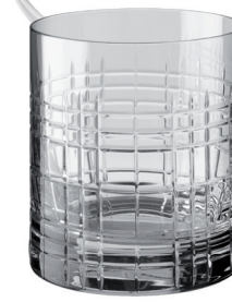
VASO WHISKY TALLADO 380 ML REF: VAG6799WT

Capacidad / Capacity: 390 ml / 13,19 oz. Diámetro / Diameter: 88 mm. Altura / Height: 102 mm. 6 unidades por caja / pieces per box.