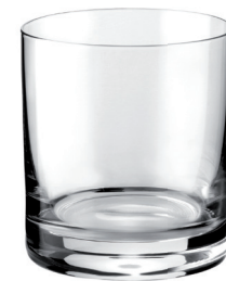
VASO WHISKY 280 ML REF: VAG1605WL

Capacidad / Capacity: 50 ml / 1,69 oz. Diámetro / Diameter: 39 mm. Altura / Height: 76 mm. 6 unidades por caja / pieces per box.