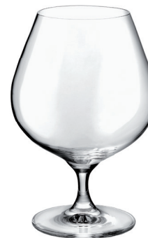
COPA BRANDY REF: CO6006BR

Capacidad / Capacity: 660 ml / 22,32 oz. Diámetro boca / M. Diameter: 74 mm. Diámetro / Diameter: 113 mm. Altura Cáliz / Calyx height: 115 mm. Altura Total / Total height: 166 mm. 6 unidades por caja / pieces per box.