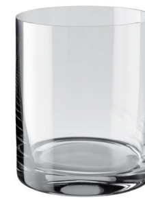
VASO WHISKY 390 ML REF: VAG6799WL

Capacidad / Capacity: 280 ml / 9,47 oz. Diámetro / Diameter: 80 mm. Altura / Height: 85 mm. 6 unidades por caja / pieces per box.