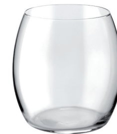
VASO ELIP 530 ML REF: VAG4932LD1

Capacidad / Capacity: 350 ml / 11,83 oz. Diámetro / Diameter: 80 mm. Altura / Height: 95 mm. 6 unidades por caja / pieces per box.