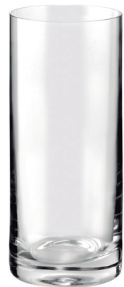
VASO HIGHBALL REF: VAG1605LD

Capacidad / Capacity: 440 ml / 14,88 oz. Diámetro / Diameter: 70 mm. Altura / Height: 161 mm. 6 unidades por caja / pieces per box.