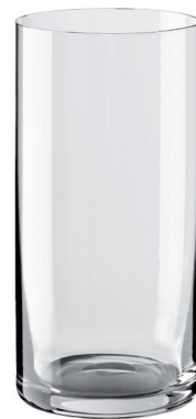
VASO LONG DRINK XXL REF: VAG6587XXL

Capacidad / Capacity: 490 ml / 17,25 oz. Diámetro / Diameter: 78 mm. Altura / Height: 120 mm. 6 unidades por caja / pieces per box.