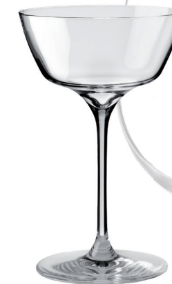
COPA CÓCTEL VINTAGE REF: CO6587CV

Capacidad / Capacity: 210 ml / 7 oz. Diámetro / Diameter: 112 mm. Altura Cáliz / Calyx height: 75 mm. Altura Total / Total height: 183 mm. 6 unidades por caja / pieces per box.