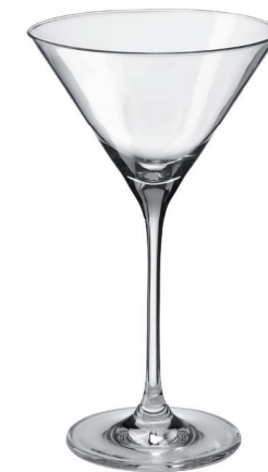
COPA CÓCTEL 210 ML REF: CO6587C

Capacidad / Capacity: 170 ml / 5,75 oz. Diámetro / Diameter: 100 mm. Altura Cáliz / Calyx height: 58 mm. Altura Total / Total height: 170 mm. 6 unidades por caja / pieces per box.