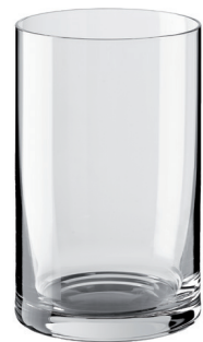
VASO LONG DRINK REF: VAG6587

Capacidad / Capacity: 440 ml / 14,88 oz. Diámetro / Diameter: 70 mm. Altura / Height: 161 mm. 6 unidades por caja / pieces per box.