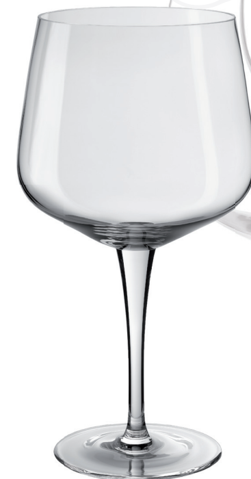
COPA GIGANTE REF: CO6587G

Capacidad / Capacity: 7000 ml / 236,70 oz. Diámetro boca / M. diameter: 203 mm. Diámetro / Diameter: 246 mm. Altura Cáliz / Calyx height: 240 mm. Altura Total / Total height: 450 mm. 6 unidades por caja / pieces per box.