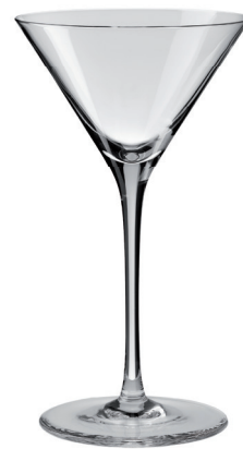
COPA CÓCTEL 170 ML REF: CO6587CP

Capacidad / Capacity: 170 ml / 5,75 oz. Diámetro / Diameter: 100 mm. Altura Cáliz / Calyx height: 58 mm. Altura Total / Total height: 170 mm. 6 unidades por caja / pieces per box.